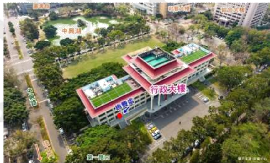
車輛進出繳費機位置